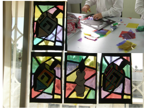
בנוסף, למדו הילדים על חושך, אור וצללים.