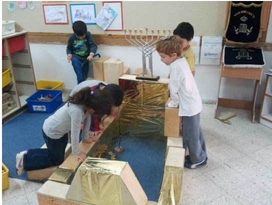
מקבוצת המפגש גם הוא, הוסיף ואמר: "גם לי תפקיד חשוב בבית המקדש. אני לוי, וסבא שלי היה שר עם כל הלויים, כי זה היה התפקיד שלהם, אז גם אני יכול לשיר".

בכתות קשת לומדים הילדים על חג החנוכה בתוכנית ספירלית. בכתה א' מתמקדים בחג החנוכה כחג האור והאש, בכתה ב' מתמקדים בחנוכיות ובשמן זית ו בכתה ג' מתמקדים בפרסום הנס. ילדי כיתה ג' למדו על הסיפור ההיסטורי של חנוכה ועל הלכות החנוכה ודיברו על האור שבי, על האור שבאחר ועל כך ש"בכל אדם דולק נר". הילדים גם הכינו עבודת ויטראז' שהתמקדה בפרסום הנס. הפרסום מתחבר לנושא השנתי של