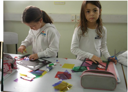
הכתה על שכונה / קהילה.

בכתות קשת לומדים הילדים על חג החנוכה בתוכנית ספירלית. בכתה א' מתמקדים בחג החנוכה כחג האור והאש, בכתה ב' מתמקדים בחנוכיות ובשמן זית ו בכתה ג' מתמקדים בפרסום הנס. ילדי כיתה ג' למדו על הסיפור ההיסטורי של חנוכה ועל הלכות החנוכה ודיברו על האור שבי, על האור שבאחר ועל כך ש"בכל אדם דולק נר". הילדים גם הכינו עבודת ויטראז' שהתמקדה בפרסום הנס. הפרסום מתחבר לנושא השנתי של